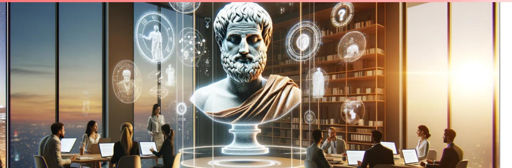
ETKİ VE İKNA SANATI

"Mükemmel düşünen, iyi konuşan, etki yaratan liderler yetiştirmek için"