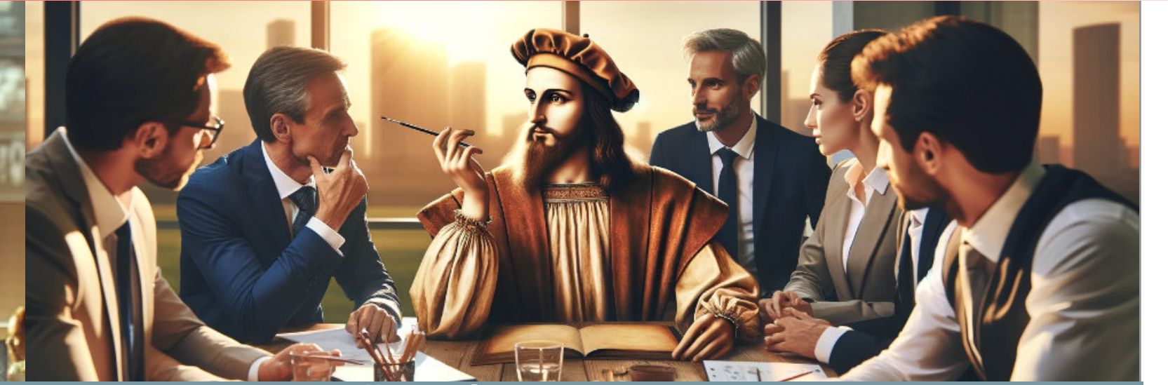
YÖNETİMDE YAPAY ZEKA

"Yapay Zeka'yı daha iyi kullanan, insan ilişkileri sağlam, ve yaratıcı ekipler yaratmak için"